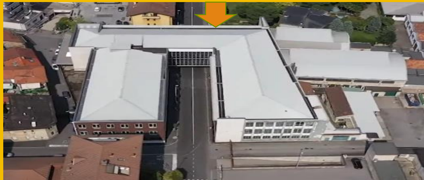
VISTA DALL'ALTO INTERA FABBRICA